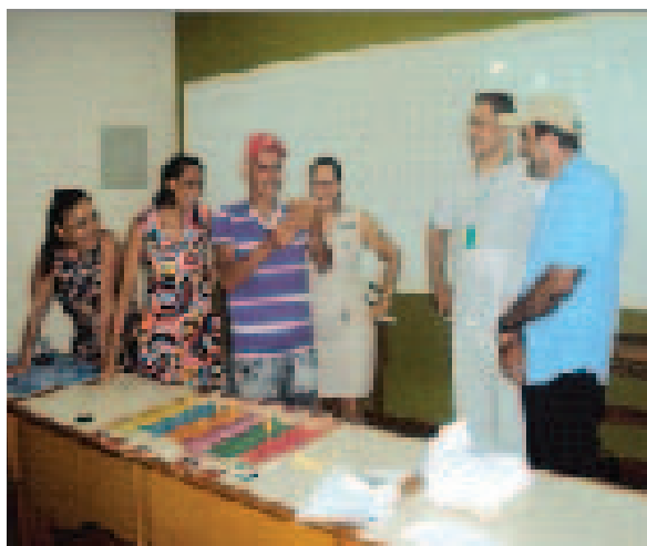
Professores rurais utilizando os materiais da mochila. Rio Branco e Acrelândia/AC