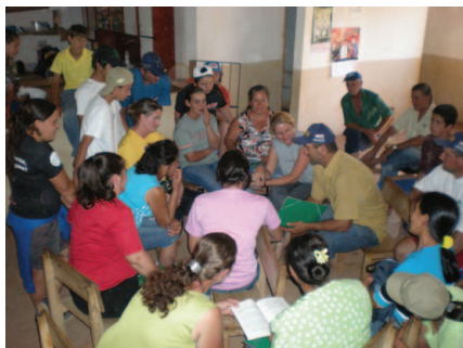
Elaboração de perguntas para minigincana.