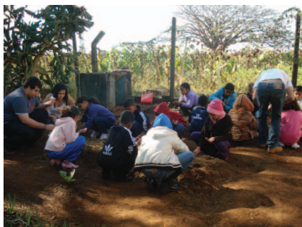
Plantio de horta orgânica na Escola Estadual Bairro Marimbondo.