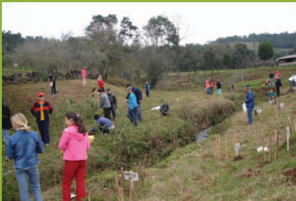
Evento de Conscientização Ambiental. São Carlos/SC, 2007

Educação Ambiental e Resolução de Conflitos Socioambientais