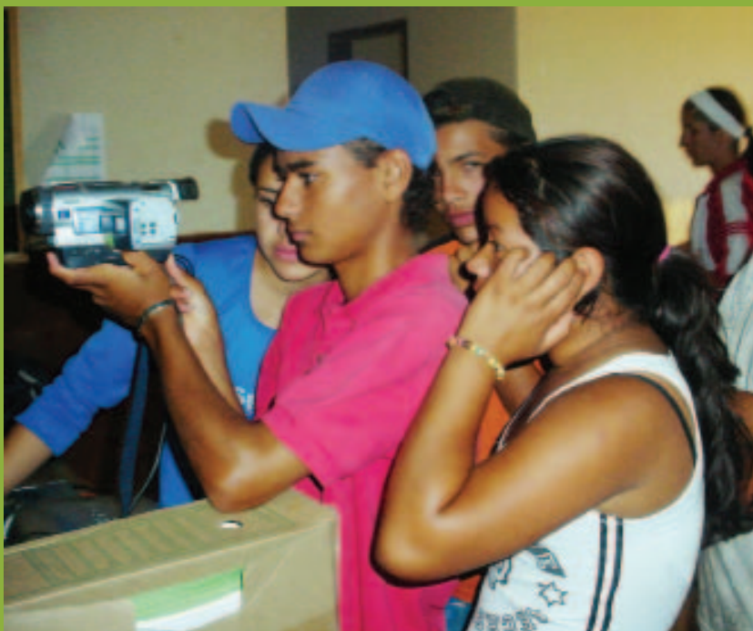
Produção de vídeo amador sobre queimadas. Assentamento Santa Lúcia. Bonito/MS, 2007

Educação Ambiental, Geração de Renda, Produção Sustentável e Tecnologia Social