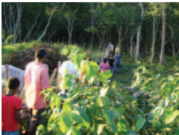
Dia de campo com agricultores. Matias Olímpio/PI