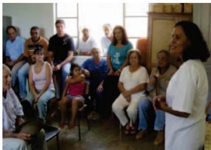
Sensibilização em comunidades rurais. Capela do Saco, São Sebastião, Traituba e Carrancas /MG, 2008.