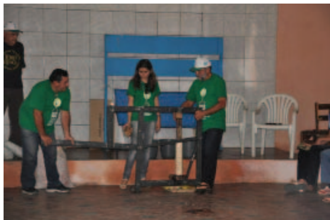
Prensa artesanal de briquetes. Oficina de Guaramiranga/CE, 2012.