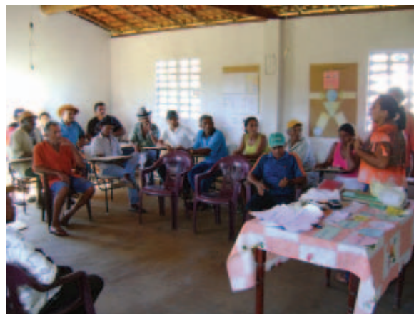
Oficinas comunitárias. Matias Olímpio/PI

Foto: Banco de Imagens do Projeto de Valorização do Jaborandi, Anidro do Brasil/GIZ