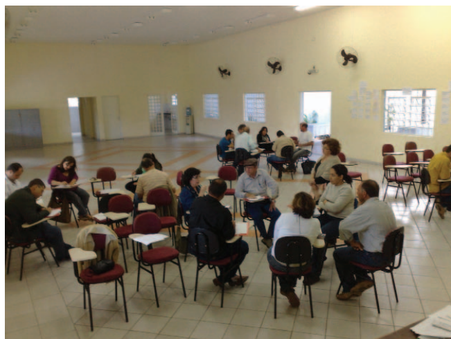
Reconstrução do processo pedagógico, com professores. Escola Técnica Martinho Di Ciero. Itu/SP, 2009.