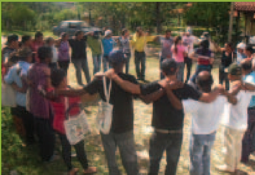
Sensibilização para Agroecologia e Gestão Social no DRS. São Gonçalo do Rio das Pedras, Serro/MG

Educação Ambiental, Geração de Renda, Produção Sustentável e Tecnologia Social