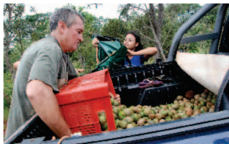
Coleta dos frutos do cerrado