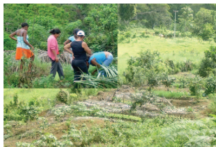
Mulheres monitoram horta, 2007.