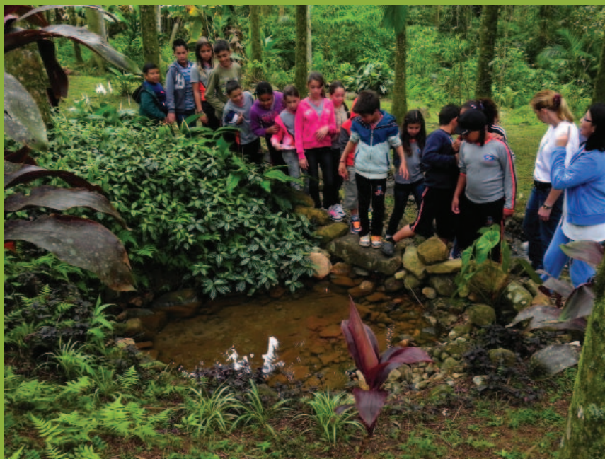
Visita técnica do curso em serviços públicos de saúde, 2009

Educação Ambiental, Geração de Renda, Produção Sustentável e Tecnologia Social