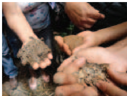
Tipos de solo. Evento de Agroecologia na área do CAV. Turmalina-MG.