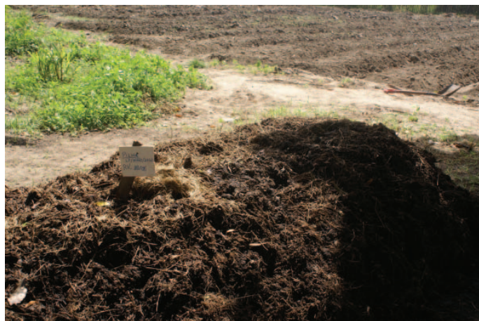
Figura 13: Aula prática de compostagem. Jardim/CE