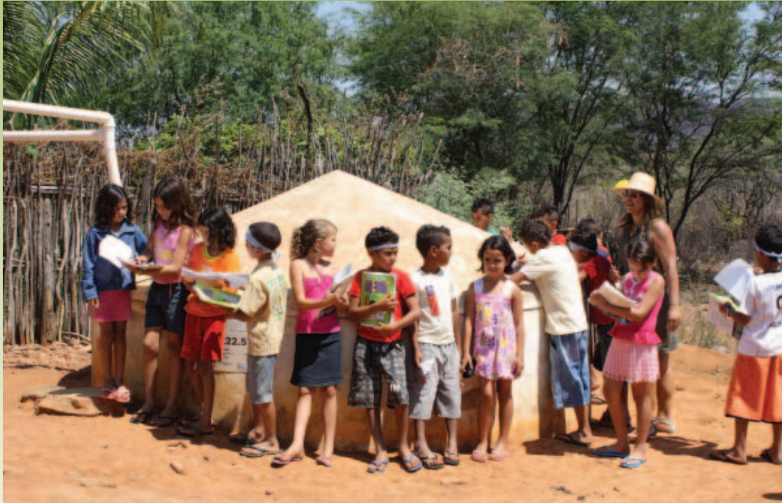
Diagnóstico das fontes de água, pela Escola José Joaquim do Nascimento. Comunidade de Riachão. Calumbi/PE, 2010.

“Para quem aponta a desesperança e o comodismo como sinais dos tempos atuais, estas ações apontam para a dedicação, firmeza e amor como sinais de uma sociedade que acredita no ser humano e no seu potencial de viver em harmonia com o planeta”.