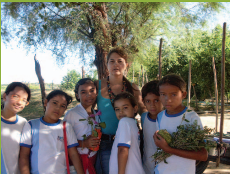
Aula de campo da Escola Municipal de Pintada. Afogados da Ingazeira/PE