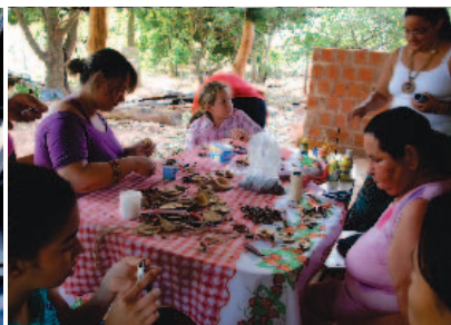
Oficina de artesanato