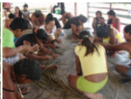
Oficina de artesanato com fibras vegetais. Comunidade Nova Esperança, 2010.

Estima-se que há dois milhões de anos as florestas tropicais ocupavam 12% da superfície do planeta (16 milhões de km 2 ). Na década anterior, esse montante não passava de 70% da área original, correspondendo a 11,2 milhões de km 2 . (MEIRELLES, 2006). As causas mais frequentes dessa mudança, principalmente nos trópicos, relacionam-se à transformação das áreas de floresta por meio da expansão agrícola, da pecuária, da mineração, da infraestrutura (represas, hidrelétricas, estradas), do processo de urbanização e da exploração madeireira (GEIST e LAMBIN, 2001; MORAN e OSTROM, 2009).