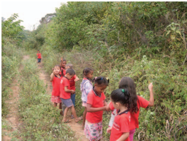
Aula de campo da Escola Municipal de Sítio Gameleira. Município de Carnaíba/PE.