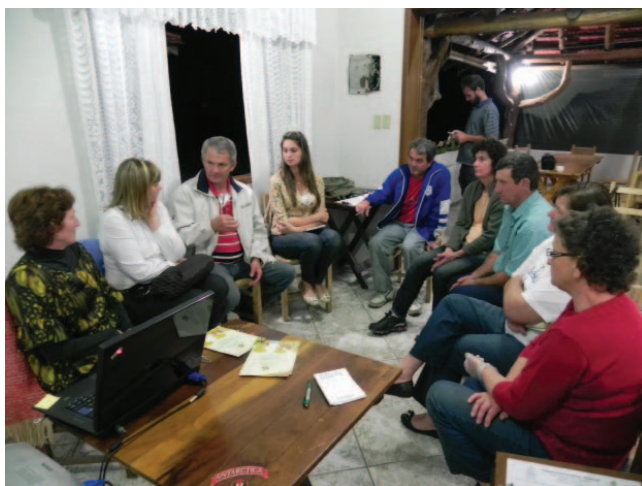
Oficina Meio Ambiente e Recursos Naturais. Propriedade Café Rural da Família Roos.