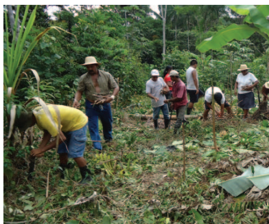
Implantação de SAF. Comunidade São Sebastião, 2012.