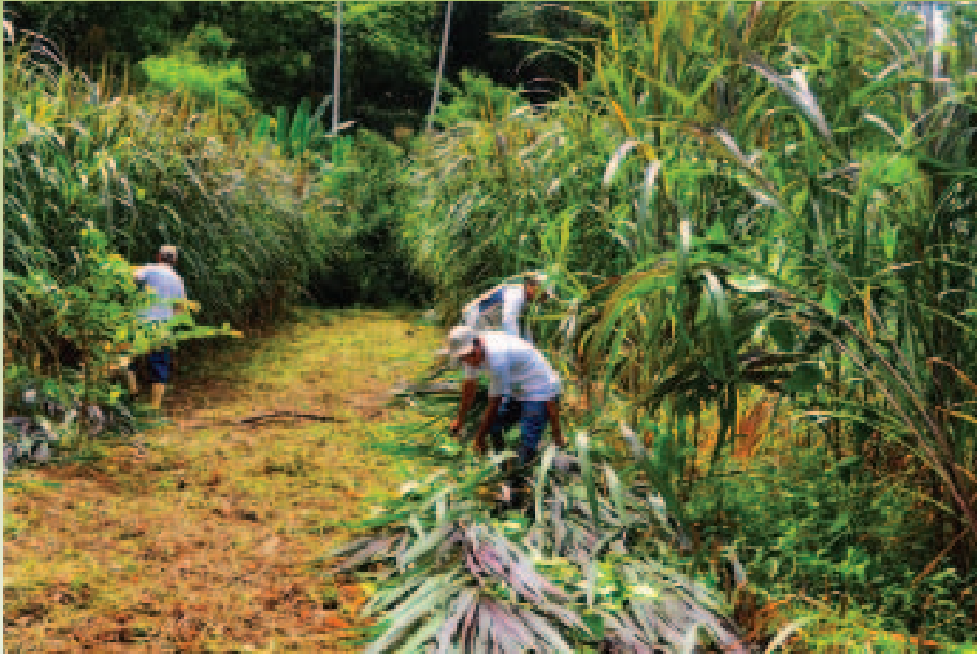
Manejo da adubação verde

“A confiança é um processo que se conquista aos poucos, na medida em que se percebem os resultados”. (Educação, Trabalho e Convivência na Recuperação do Rio Pequeno)