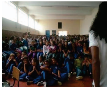
Sensibilização na Escola Estadual Sarah Kubitchek. Carrancas /MG, 2008.