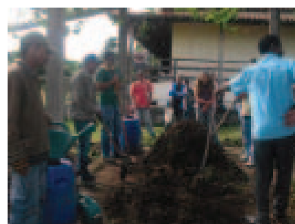
Composteira. Projeto Terra Mãe, FUNIVALE. São Gonçalo do Rio das Pedras. Serro-MG.

Desde 2009, ano em que ocorreu o Grito da Terra, uma rede de cooperação envolvendo sociedade civil e poder público foi criada no Território da Cidadania do Alto Jequitinhonha/MG. Esta rede surgiu para possibilitar que agricultores familiares e conselheiros do CMDRS 79 , dos 23 municípios do Alto Jequitinhonha, em Minas Gerais, participassem de atividades de fortalecimento da agricultura familiar e do desenvolvimento rural sustentável.