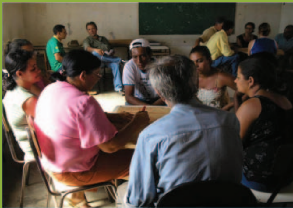
Oficina Participativa. Comunidade Tabocal, 2005

Educação Ambiental, Geração de Renda, Produção Sustentável e Tecnologia Social