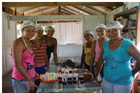
Grupo de mulheres no Clube de Mães. Relatório do IPÊ, 2011.