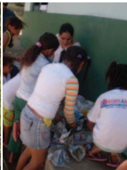
Aula de separação de resíduos sólidos e reciclagem da Escola Municipal de Capim, Município de Sertânia/PE, 2009.

A crise ambiental atual é discutida por diversos setores e atores sociais, governamentais ou não-governamentais 40 , bem como, pelo senso comum da sociedade no exercício da cidadania. Recentemente este debate vem se intensificando nos diferentes setores, ao tratar de escassez futura de água potável, desertificação, exploração desenfreada e esgotamento dos recursos naturais. Muitos desses fatores correspondem ao consumo acelerado, incrementado por tecnologias de produção de mercadorias, bens e serviços que favorecem a degradação da natureza pela intervenção humana.