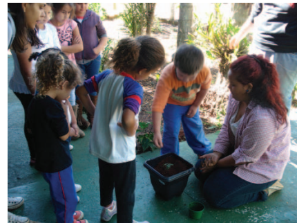
Plantio de muda de pau-brasil com estudantes.

A educação crítica tem raízes nas concepções materialistas e dialéticas da história e nos ideais democráticos e emancipatórios do pensamento crítico, aplicados à educação (PUCCI, 1995). O encontro da educação ambiental com o pensamento crítico, dentro do campo educativo, é um dos promotores da potência de ação (CARVALHO, 2004), que está relacionada com a capacidade dos sujeitos agirem no mundo e transformarem a realidade da maneira que desejam (SANTOS e COSTA-PINTO, 2005). Paulo Freire coloca em sua obra que a educação deve permitir a formação de sujeitos sociais emancipados, isto é, autores da própria história (GADOTTI, 1997). O projeto político-pedagógico de uma educação ambiental crítica seria contribuir para a formação de um sujeito ecológico, ou seja, de indivíduos e grupos sociais capazes de identificar, problematizar e agir em relação às questões socioambientais tendo como horizonte uma ética preocupada com a justiça ambiental (CARVALHO, 2004).