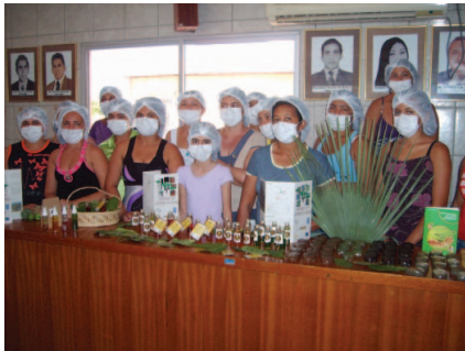
Oficina de produção de fitoterápicos e fitocosméticos. Carnaubais/RN.