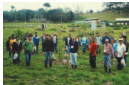
Visita ao Centro de Educação Ambiental do HSBC. Caucaia do Alto. Cotia/SP.

O Desenvolvimento Rural Sustentável (DRS) é um processo resultante de ações articuladas, que induz mudanças socioeconômicas e ambientais na área rural, substituindo tecnologias agressivas ao meio ambiente, valorizando a saúde do trabalhador, o bem-estar das populações rurais e de toda a sociedade.