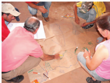
Construção do mapa do Projeto de Assentamento com as APPs e RL.