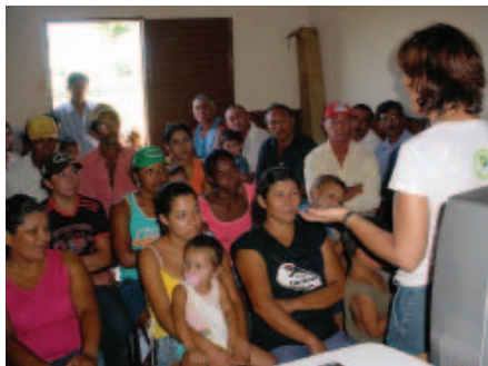
Mobilização dos moradores do Assentamento Santa Lúcia. Bonito – MS, 2006.