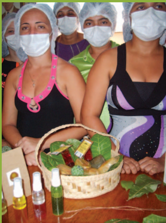
Oficina de produção de sabonetes e óleos corporais. Carnaubais/RN

Educação Ambiental, Geração de Renda, Produção Sustentável e Tecnologia Social