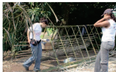
Tecnologias socioambientais. UEPs. Carrancas/MG, 2008.

O projeto foi desenvolvido com agricultores familiares do município de Carrancas, localizado na bacia do Alto Rio Grande, na macro-região sul do estado de Minas Gerais, meso-região do Campo das Vertentes 133 . O município de Carrancas possui 4.015 habitantes. Em torno de 57% de suas propriedades rurais tem área inferior a 100 hectares, 22% delas têm até 200 hectares e 21% acima de 200. Sendo assim, a maior parte é classificada como pequenos estabelecimentos rurais, distribuídos em comunidades como São Sebastião, Capela do Porto do Saco, Traituba e Estação de Carrancas. Essas áreas foram adquiridas em decorrência de processos trabalhistas devido à falência de fazendas, ou por herança. Neste município, as principais atividades rurais são a pecuária leiteira e a produção de milho para grãos e silagem, apresentando grande importância econômica e social para a região, em função do número de produtores familiares envolvidos. Grande parte dos agricultores familiares tem a atividade leiteira como principal fonte de renda, seja trabalhando para si ou como empregados, em fazendas vizinhas. Também produzem hortaliças, frutas, feijão, milho e criam pequenos animais para o autoconsumo.