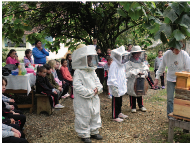
Visita das Escolas ao Apiário Pfau.

Joinville é um município localizado na região Sul do País, com uma área de 1.134,03 km 2 192 . São 509.293 habitantes (IBGE, 2011) concentrados principalmente na área urbana, e equivalendo a 8,24% da população do Estado. Configurando-se como a mais populosa de Santa Catarina, a cidade de Joinville está numa localização geográfica estratégica, próxima a várias cidades urbanizadas e é polo da microrregião nordeste do Estado, responsável por 20% de suas exportações. Grande parte da atividade econômica provém do setor industrial, metalmecânico, têxtil, plástico, metalúrgico, químico e farmacêutico. A região apresenta uma aglomeração de escolas. Somente na cidade de Joinville, há um universo de 90.608 estudantes no ensino infantil e fundamental.