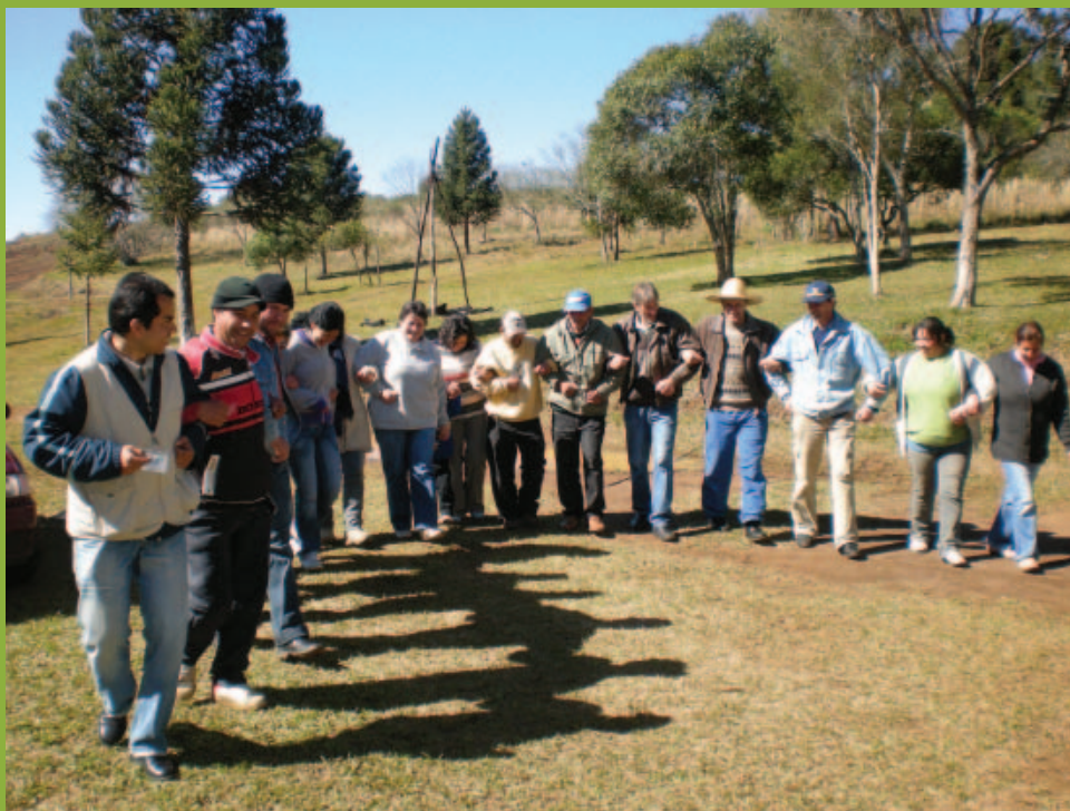
Dinâmica de “Boa Tarde”