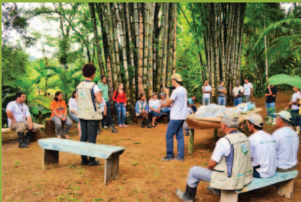
Planejamento de mutirão de plantio das espécies nativas

Educação Ambiental, Recuperação de APP e Reserva Legal