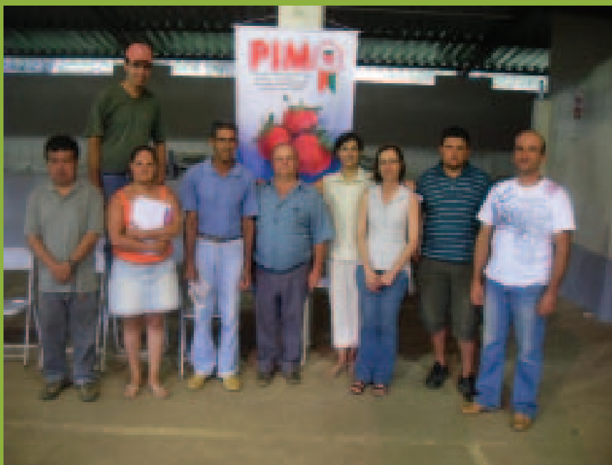
Adequação ao sistema de produção integrada de morangos. Atibaia/SP, 2009

Educação Ambiental, Geração de Renda, Produção Sustentável e Tecnologia Social