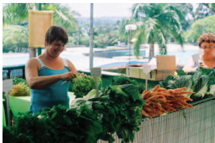
Agricultoras na banca de orgânicos. SESC Interlagos/SP.