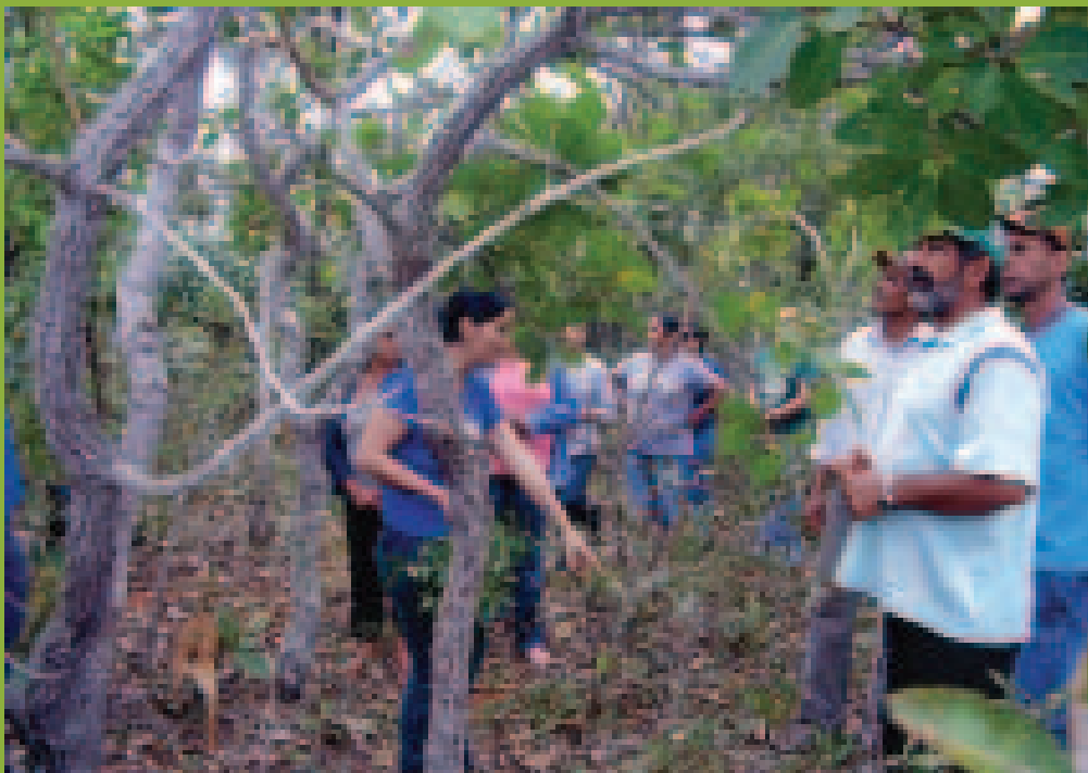
Dia de campo. Uso das espécies do cerrado. Assentamento Lagoa Grande. Distrito de Itahum, Dourados/MS

Educação Ambiental, Geração de Renda, Produção Sustentável e Tecnologia Social