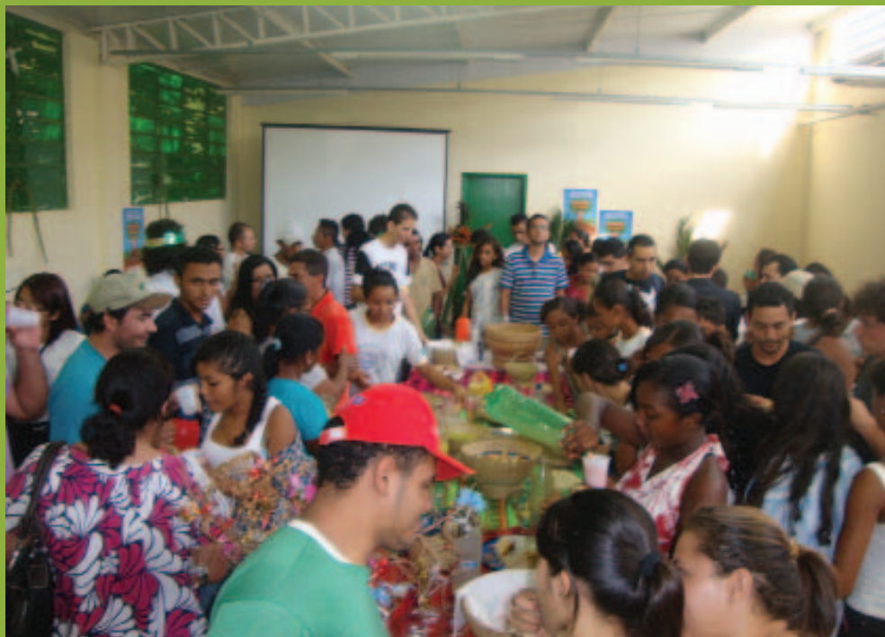
Seminário de Agroecologia e Segurança Alimentar