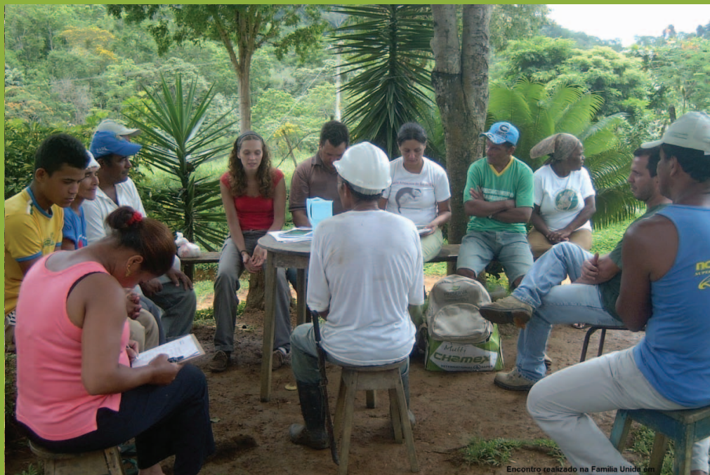
Encontro na comunidade, 2007