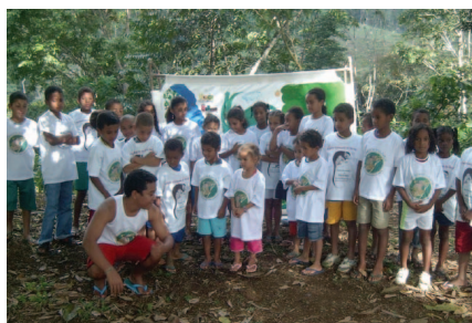
Teatro para jovens e adultos, 2006.