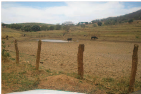
Tanque de Terra Seco Antes do Projeto. Comunidade Tabocal, 2005.