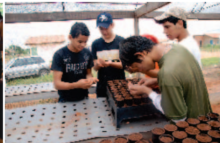
Produção de mudas

O Cerrado é um dos biomas mais diversos do Brasil. Ocupa aproximadamente 21% do território nacional e abriga cerca de 33% da diversidade biológica brasileira (AGUIAR, MACHADO e MARINHO FILHO, 2004). No entanto, a conversão de grandes extensões de vegetação nativa em pastagens e monoculturas, na região Centro-Oeste, contribuiu para que o Cerrado se tornasse um dos biomas mais ameaçados do mundo (KLINK e MACHADO, 2005).