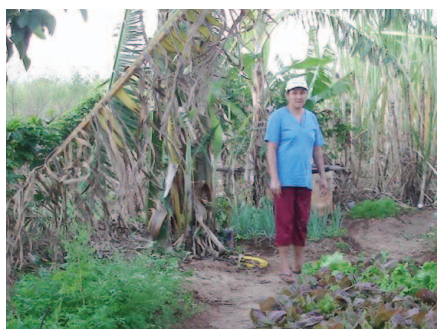
Arranjo produtivo agroecológico.