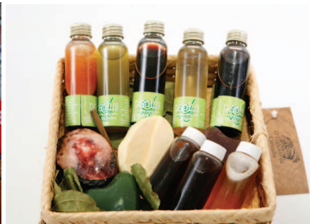
Sabonetes, extratos e óleos corporais. Espécies da Caatinga.

A Associação de Desenvolvimento de Produtos da Sócio-Biodiversidade – FITOVIDA vem desenvolvendo um trabalho de mobilização e capacitação para o uso não madeireiro de recursos da Caatinga. Este trabalho é realizado em várias etapas e inicia-se com o contato com as comunidades e a celebração de parcerias, com vistas ao treinamento sobre boas práticas de coleta, beneficiamento, produção de extratos e desenvolvimento de produtos obtidos por meios de extrativismo sustentável e a observação e adequação às normas higiênico-sanitárias.