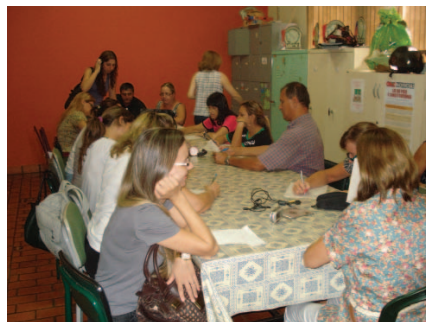
Curso de formação continuada de professores de escolas rurais.