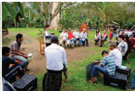
Avaliação da adubação verde, das mudas nativas e da Cartilha EA.