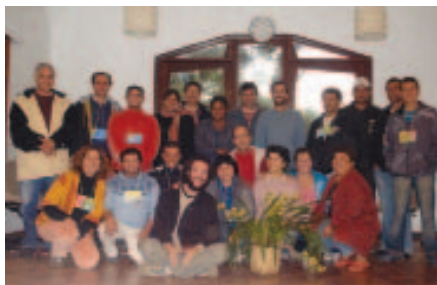
Agricultores e equipe gestora do projeto no Centro Paulus.