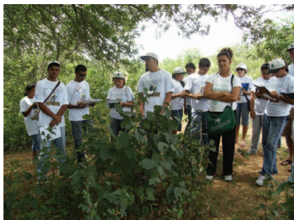
Alunos do curso de sementes. Tangará/RN.