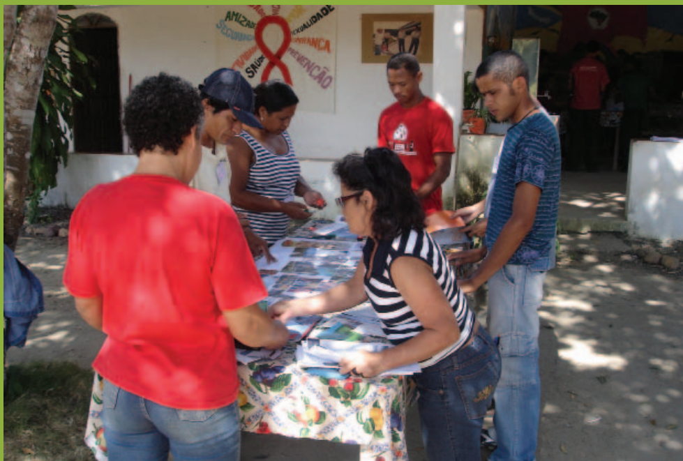
Educandos em atividades pedagógicas do curso, 2008