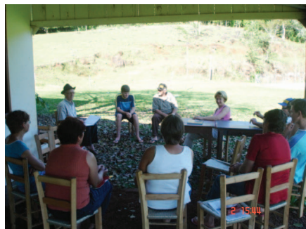
Reuniões de planejamento do projeto. São Carlos/SC, 2006.