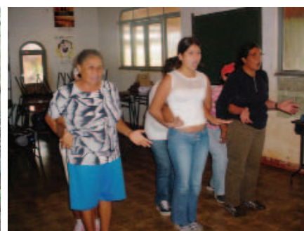
Oficina de teatro para moradores do Assentamento.

O Assentamento Santa Lúcia ocupa uma área plana e bastante desflorestada no bioma Cerrado. Localiza-se a 35 quilômetros do município de Bonito, no Mato Grosso do Sul, e a 10 do Parque Nacional da Serra da Bodoquena. A área do assentamento soma 1.026,744 hectares. Ao sul há uma extensa área de banhado e várzea, na cabeceira do Rio da Prata, com vegetação predominantemente herbácea e arbustiva. A nordeste do assentamento existe uma mata do tipo Cerradão. As demais áreas lindeiras são ocupadas com agricultura e pecuária. O assentamento possui duas áreas protegidas, sendo uma Área de Preservação Permanente (216,25 hectares), de várzea, e uma área de Reserva Legal (205,88 hectares), com floresta em estágio avançado de degradação.