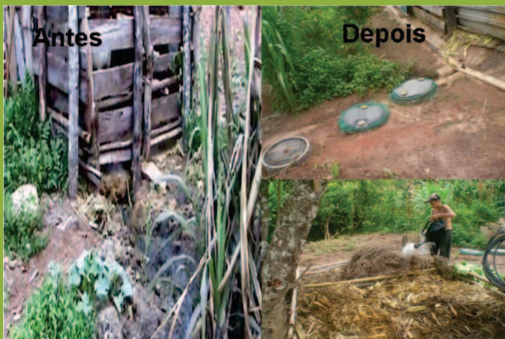
Erradicação de poluição da pocilga. UEP Canudo. Carrancas/MG, 2008

Educação Ambiental, Geração de Renda, Produção Sustentável e Tecnologia Social