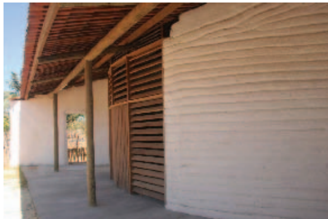
Cozinha experimental construída com técnicas de bioconstrução/CE.

Icapuí é um município do Estado do Ceará, com 64 quilômetros de praia e uma população de 19.292 pessoas. A pesca, o turismo, a extração de sal e o cultivo do caju são suas principais atividades econômicas. Possui ecossistemas diversificados: campos de dunas, falésias, carnaubal, manguezal e o segundo maior banco de algas marinhas do Brasil. A expressiva biodiversidade guarda resquícios do Manguezal da Requenguela e do Banco de Algas dos Cajuais, que são considerados estratégicos para a conservação do peixe-boi marinho, além de importante fonte de alimentação, reprodução e refúgio de aves migratórias. O município apresenta um conjunto paisagístico de grande relevância no contexto regional e nacional, com um complexo ecossistema indispensável à manutenção da biodiversidade.