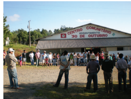
Roda de encerramento e avaliação.

O ambiente rural é caracterizado pela forte ligação do ser humano com a natureza. Os recursos naturais, como o solo, a água, as plantas e os animais são essenciais para manutenção do ser humano no campo, e tais recursos devem estar em boas condições para permitir também a sua sobrevivência financeira.