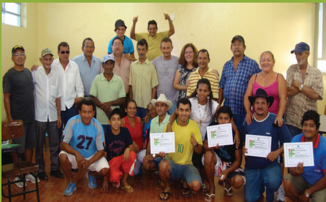
Reunião no Instituto Federal de Educação, Ciência e Tecnologia, 2009

Educação Ambiental, Geração de Renda, Produção Sustentável e Tecnologia Social