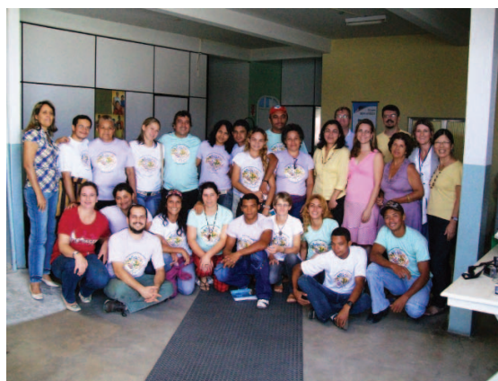
Visita técnica do curso em serviços públicos de saúde, 2009

O “Curso de Especialização Técnica em Saúde Ambiental para a População do Campo”, iniciado em 2008 e finalizado em 2009, foi realizado pela Escola Politécnica de Saúde Joaquim Venâncio (EPSJV) 178 , por meio de seu Laboratório de Educação Profissional em Vigilância em Saúde (LAVSA) 179 . Este curso fez parte do projeto de desenvolvimento tecnológico “Formação de Formadores em Saúde Ambiental nos Territórios dos Assentamentos do Movimento dos Trabalhadores Sem Terra (MST): uma estratégia para o enfrentamento dos Determinantes Sociais da Saúde (DSS) da população do campo” 180 .