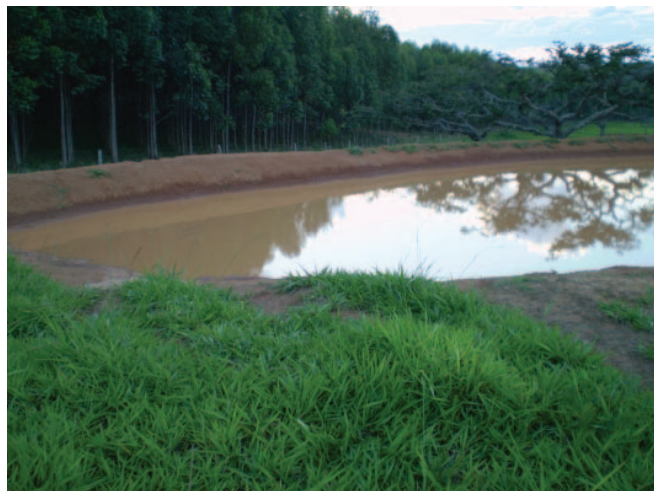
Conservação de solo e água. Luz/MG.