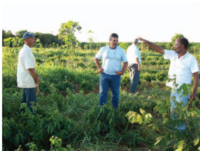
Sistema agroflorestal. Bambuí/MG.

É na região do Cerrado que estão as cabeceiras de 06 (seis) das 08 (oito) grandes Bacias Hidrográficas do país como a Amazônica, Tocantins-Araguaia, Atlântico Norte-Nordeste, São Francisco, Atlântico Leste e Paraná-Paraguai, respondendo por 14% da produção hídrica do país. Portanto, a gestão dos recursos ambientais no Cerrado, propaga tanto efeitos positivos quanto impactos negativos por extensões muito maiores do que a sua própria área de abrangência, uma vez que ocorre nas áreas de montante desses mananciais, influenciando direta e indiretamente a biodiversidade e a sustentabilidade socioambiental e econômica de milhões de pessoas.