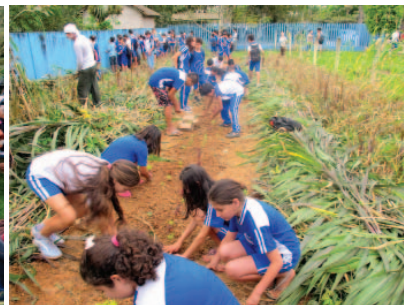
Mutirão para Implantar SAF. Escola Estadual Profª Maria Arminda. Antonina/PR.

A Bacia Hidrográfica do Rio Pequeno, em Antonina, no litoral norte do Paraná, é uma região de 112,6 Km 2 que está integralmente inserida na Área de Proteção Ambiental (APA) de Guaraqueçaba 157 . Esta é uma Unidade de Conservação Federal de Uso Sustentável que integra a maior porção contínua de Floresta Atlântica do país. Um quarto de seu território pertence ao Corredor de Biodiversidade do Rio Cachoeira. Esta região agrega um dos menores índices de desenvolvimento do Estado e é de relevante importância ambiental.