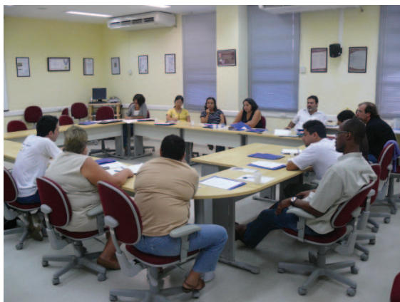
Oficina de construção do curso, com professores e MST, 2008.