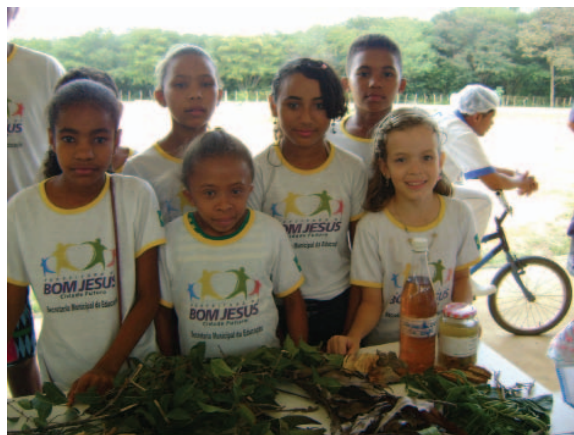
Barraca das Plantas Medicinais. Segunda Exposição de Talentos.

No Brasil, são escassos os trabalhos acadêmicos que consideram os aspectos social, ambiental e educacional, desenvolvidos no âmbito das escolas rurais, como espaços de formação que contribuem para a continuidade e a reprodutividade da agricultura familiar. Esta situação se agrava quando se refere às escolas do campo, cujas pesquisas não chegam a 1% (ARROYO, 2004).