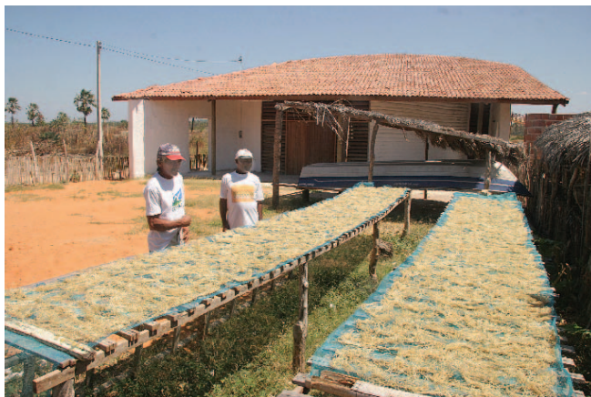
Secagem de algas marinhas /CE.