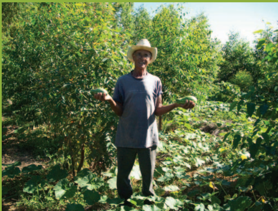
Sistema agroflorestal simplificado. Bambuí/MG

Educação Ambiental, Geração de Renda, Produção Sustentável e Tecnologia Social