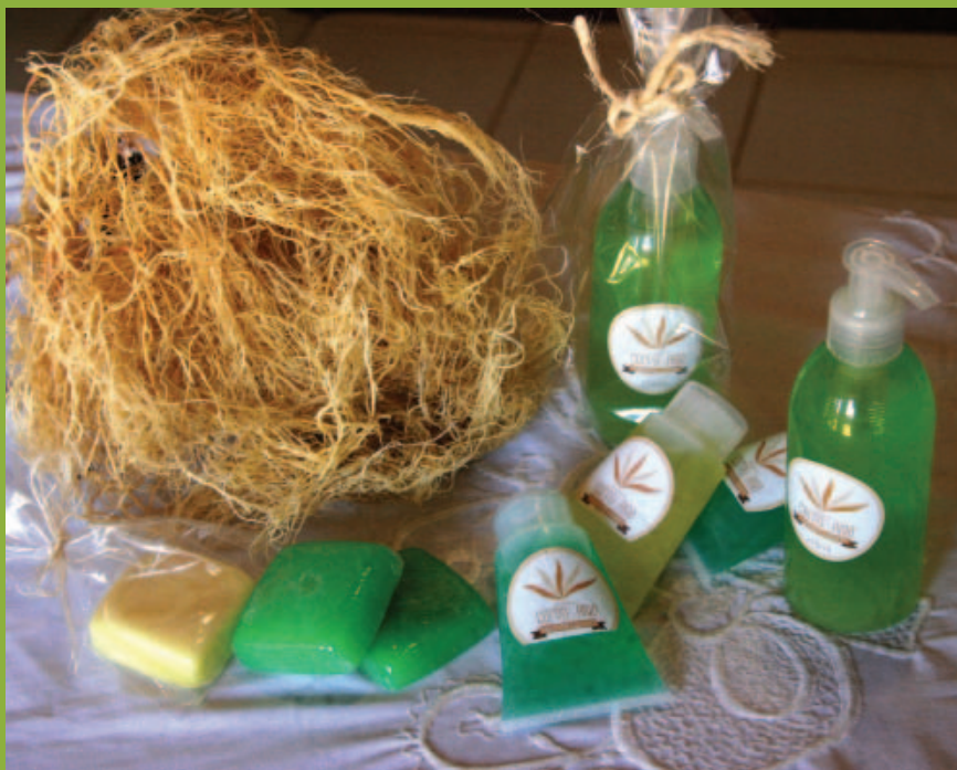
Produtos à base de algas marinhas

Educação Ambiental, Geração de Renda, Produção Sustentável e Uso de Tecnologia Social