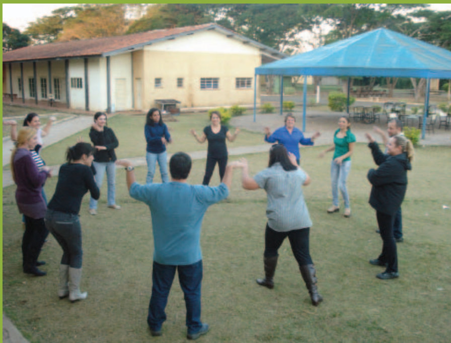
Oficina de dinâmicas com professores. Araras/SP

Organizador Rodolfo Antônio de Figueiredo