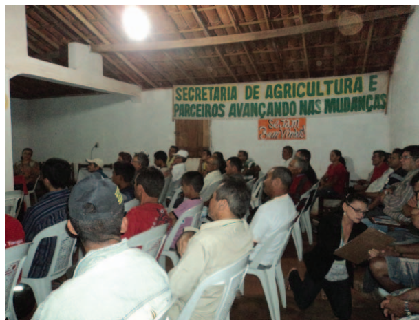
Aula inaugural do curso. São Benedito/CE

A Caatinga é um bioma rico, pois apesar de estar localizado em área de clima semiárido, apresenta grande variedade de espécies e paisagens (IBAMA, 2012). Ao longo dos anos, esse bioma vem sendo agredido por meio de práticas que visam à utilização da terra para fins agrícolas. A agricultura moderna, extremamente consumista, não se preocupa em retornar o material orgânico à terra, em forma de adubo e tão pouco o material inorgânico (latas, vidros) para a indústria 38 . É necessário buscar conhecimentos que conciliem a preservação desse bioma sem que haja comprometimento dos níveis de segurança alimentar (produção agrícola).