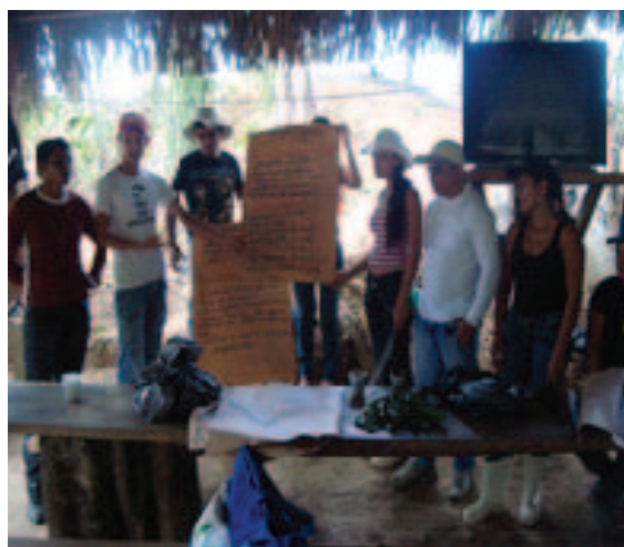
Formação de professores rurais. Município de Tarauacá/AC.

O Estado do Acre, localizado no extremo ocidental do Brasil, com área de 16,5 milhões de hectares e população estimada em 656.000 habitantes, possui cinco regiões estratégicas para o desenvolvimento do Estado 6 e para a integração internacional 7 , totalizando 22 municípios e 04 zonas de desenvolvimento (ACRE, 2006). Sua ocupação está historicamente associada ao aproveitamento dos produtos da floresta, permitindo a preservação do seu patrimônio natural no processo de desenvolvimento econômico. Mais de 88% da área do Acre é composta por cobertura florestal original (ACRE, 2006).