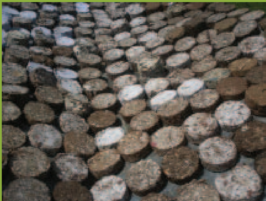
Produção artesanal de briquetes

Educação Ambiental, Geração de Renda, Produção Sustentável e Tecnologia Social