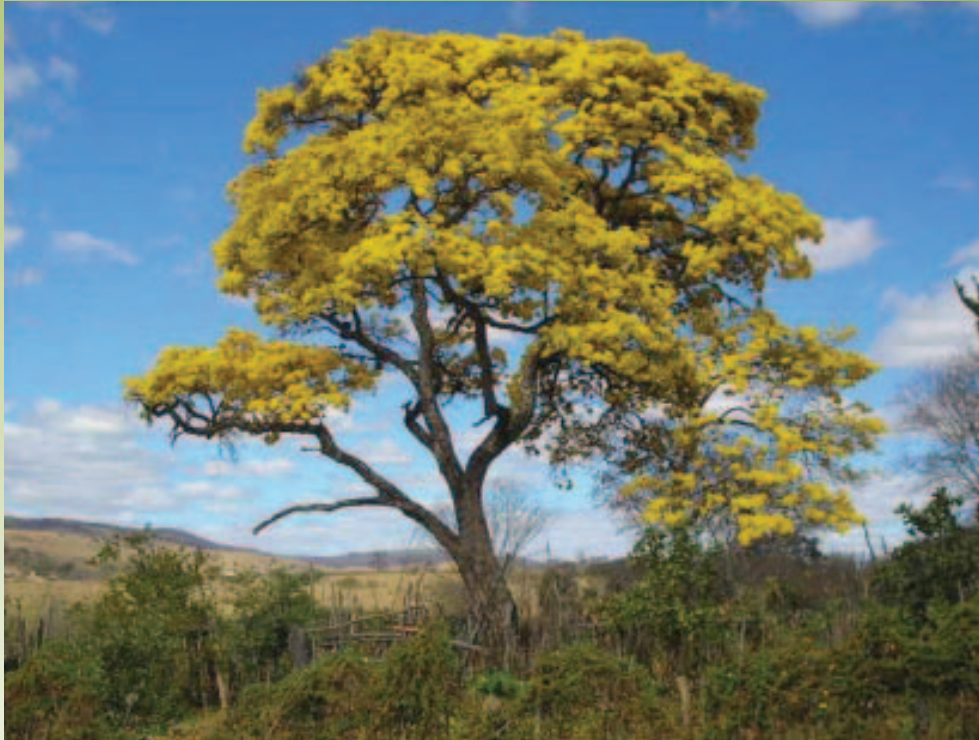
Ipê Amarelo. Comunidade Caiçara. Glaucilândia/MG, 2008

“Organizar ideias e colocá-las no papel é uma tarefa fácil em relação a implantá-las e fazê-las funcionar. Para isso é necessário que haja o envolvimento e a efetiva participação dos atores locais, com a contrapartida das políticas públicas e parceiros”.