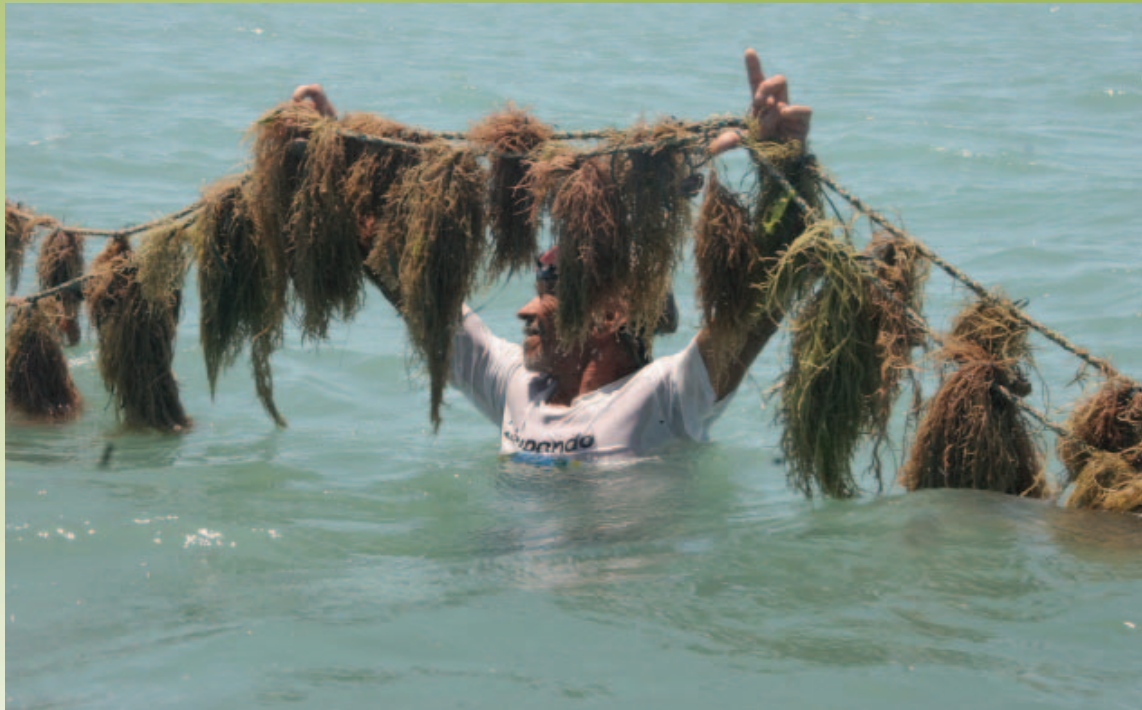
Cultivo de Algas Marinhas /CE

“Estas técnicas são parte de um conjunto de ações que levam a entender o território onde a ação é executada, de forma sistêmica. Parte do cultivo serve de alimentação para os peixes e demais exemplares da fauna marinha. A comunidade, por sua vez, alimenta-se dos peixes, numa espécie de conexão da “teia da vida”.