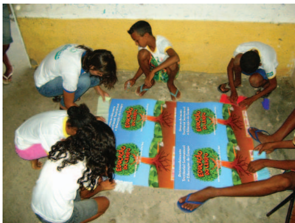
Educação do Campo na Escola Marco Julio.