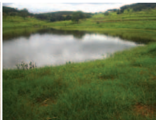
Tanque de Terra Recuperado após implantação do projeto. Comunidade Tabocal, 2006.

A sub-bacia do Rio das Pedras 49 , principal bacia do município de Glaucilândia, no norte de Minas Gerais, está localizada dentro do polígono da seca 50 , no bioma Cerrado. Pertence à sub-bacia do Rio Verde Grande, uma das principais sub-bacias do Rio São Francisco e ocupa uma área de 146,06 Km 2 , com uma população de 2.842 habitantes, sendo que a maioria reside na zona rural. A atividade econômica predominante é a agropecuária 51 , que estabelece vínculo de mercado com municípios vizinhos 52 .