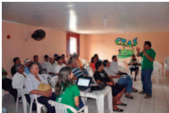
Oficina de produção de briquetes. II Semana de Reflorestamento do Maciço de Baturité, 2012. Foto: Adriano Soares

Em todo o Brasil, principalmente no Nordeste, o baixo nível de escolaridade de agricultores(as) é preocupante. Colaboram com a formação deficitária do camponês: a sua baixa renda média anual, que em muitos casos não atinge um salário mínimo ao mês; a falta de acesso à assistência técnica; e, a quase total exclusão dos meios digitais. O “lixo” é um grande problema ambiental enfrentado pelos municípios, inclusive em suas áreas rurais. Desta forma, as soluções possíveis para esta questão, esbarram nesses condicionantes, agravados pelo fato do “lixo” ser visto como tabu e a gestão integrada de resíduos sólidos não constar na agenda de muitos gestores.