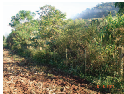
Três meses após a conclusão do primeiro projeto. São Carlos/SC, 2006.

No Oeste de Santa Catarina predomina a pequena propriedade rural. Enquanto o novo Código Florestal prevê casos de redução das Áreas de Preservação Permanente, essa experiência mostra como se pode dirimir o conflito entre a produção e a conservação.