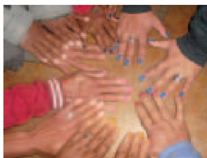
Agricultoras em evento de Agroecologia. São Gonçalo do Rio das Pedras. Serro/MG.