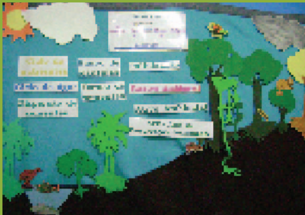
Flanelógrafo do ativo ambiental. Formação de professores rurais em Rio Branco/AC