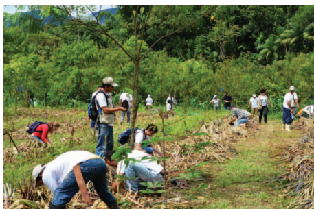
Encontro de plantio das espécies nativas da Floresta Atlântica.