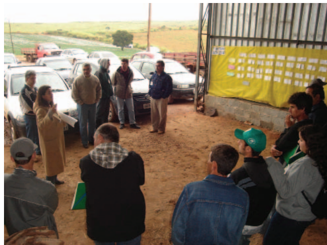
Reconstrução do conhecimento tradicional, com produtores. Atibaia/SP, 2006.

A Macroeducação 147 é um conjunto de técnicas, métodos e materiais desenvolvidos pela Embrapa Meio Ambiente com o objetivo de sistematizar um processo de conscientização que resulte na mudança de atitude de agricultores familiares, alunos de escolas rurais e técnicos agrícolas, por meio da formação de multiplicadores da extensão rural e de redes de ensino público, respectivamente.