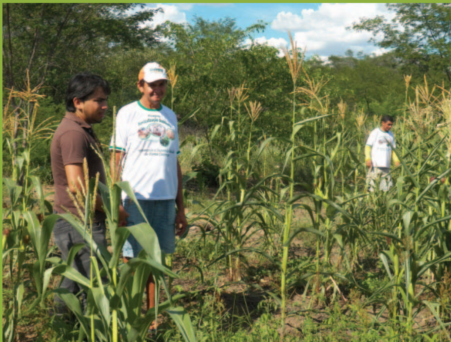
Aula de campo. SAF de Antônio M. Neto. Distrito de Irapuá. Crateús/CE, 2012

Educação Ambiental, Geração de Renda, Produção Sustentável e Tecnologia Social