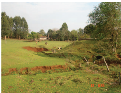
Situação inicial do projeto. São Carlos/SC, 2006.