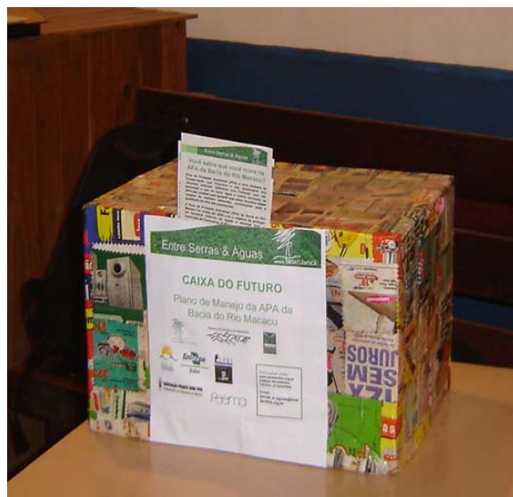
Caixa do Futuro