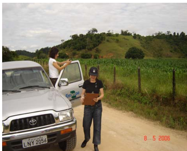
Equipe da EMBRAPA SOLOS observando os usos do solo no município de Cachoeiras de Macacu

A seguir veja a equipe do projeto selecionando as áreas de mata a serem estudadas e os pontos para análise e coleta de água e solos.