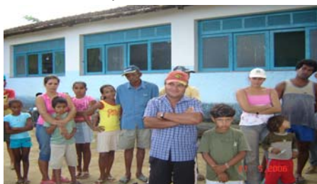
Reunião com a Comunidade de Serra Queimada

Além disso, reuniões de trabalho e atividades na região estão também acontecendo. Já estão sendo viabilizados estudos sobre uso do solo, recursos hídricos bem como as áreas de mata do Município. Todas estas etapas estão sendo realizadas pelo parceiros do projeto e assim que estes estudos sejam concluídos serão apresentados à comunidade.