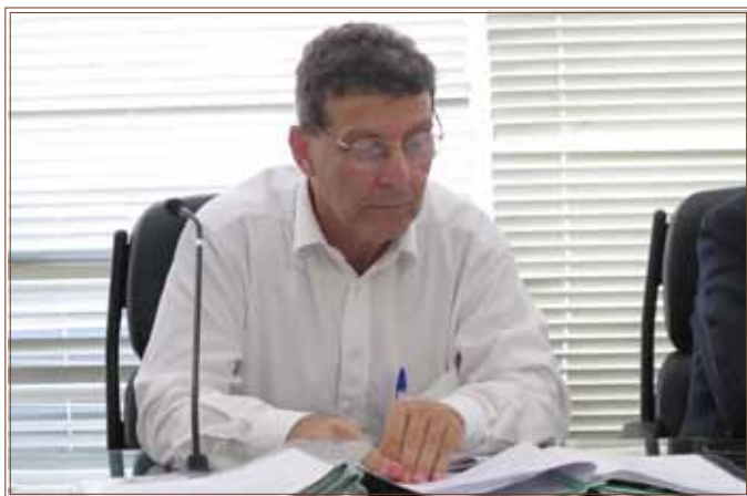
O secretário Nabil Bonduki

Nessa edição especial do aniversário de um ano da Política Nacional de Resíduos Sólidos (PNRS), o secretário de Recursos Hídricos e Ambiente Urbano, Nabil Bonduki, fez um balanço dos avanços e dos desafios enfrentados pelo Governo Federal na implementação das ações, diretrizes e prazos propostos.